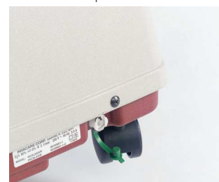
HomeFill присоединительный патрубков