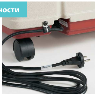
Безопасное подключение шнура электропитания